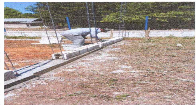
Foto 4: Se Instalo las columnas se necesita comprar 10 quintal de hierro 0 de 3/8 para la terminación de 3 aulas