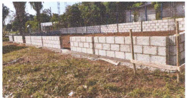
Foto 6: Aquí a llegado el aporte de la comunidad con la construcción en la cual que se necesita terminar con las puertas, ventanas y techo

Observación: Si es necesario se pueden agregar hojas adicionales y actualizar el número de hojas.