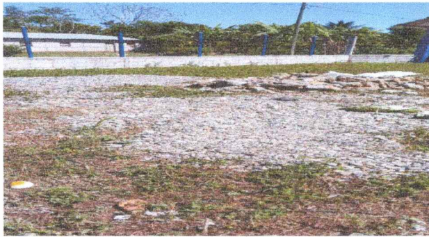
Foto 1: Tenemos poco material de arenas la cual que necesitamos 3 camionadas