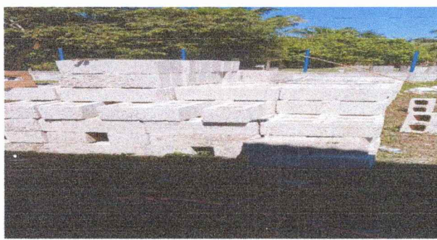
Foto 3: Tenemos pocos material de block la cual que necesitamos para terminar la construcción.